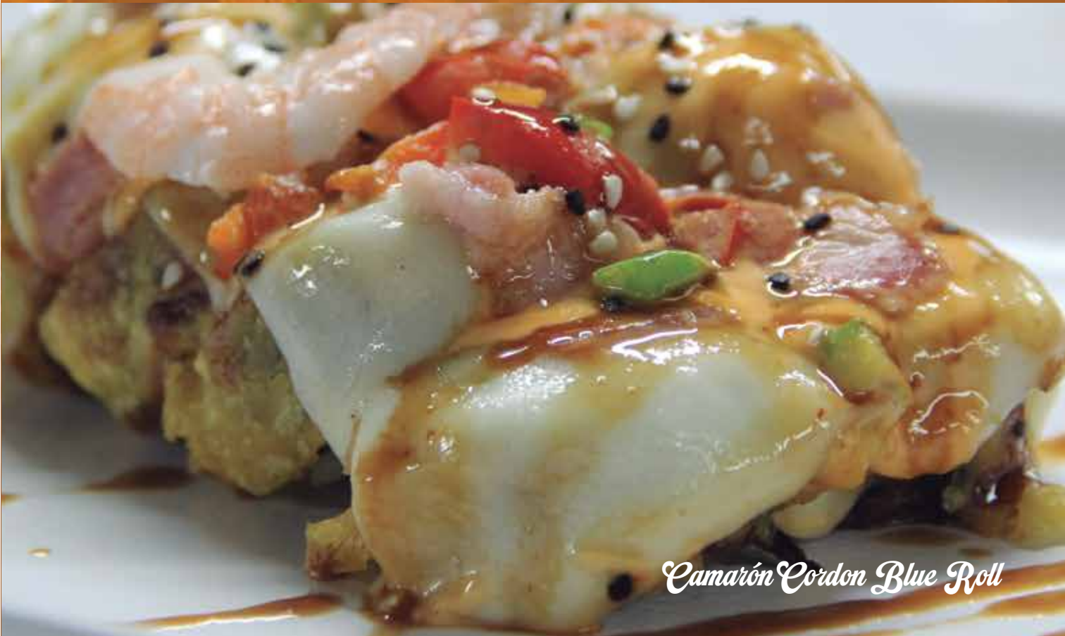
Camarón Cordon Blue Roll

POLLO, CHILE CHILACA, MORRÓN, EMPANIZADO QUESO MANCHEGO GRATINADO, AGUACATE, CEBOLLÍN Y SALSA CHIPOTLE.