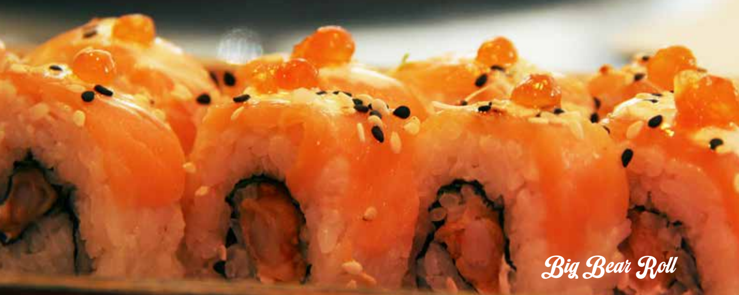
Big Bear Roll

Samy Coco Roll 129 CAMARÓN, QUESO CREMA, EMPANIZADO CON COCO Y SALSA DE MANGO.