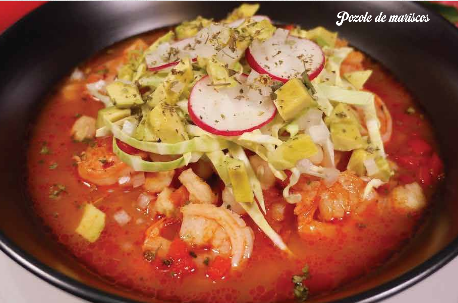
Pozole de mariscos