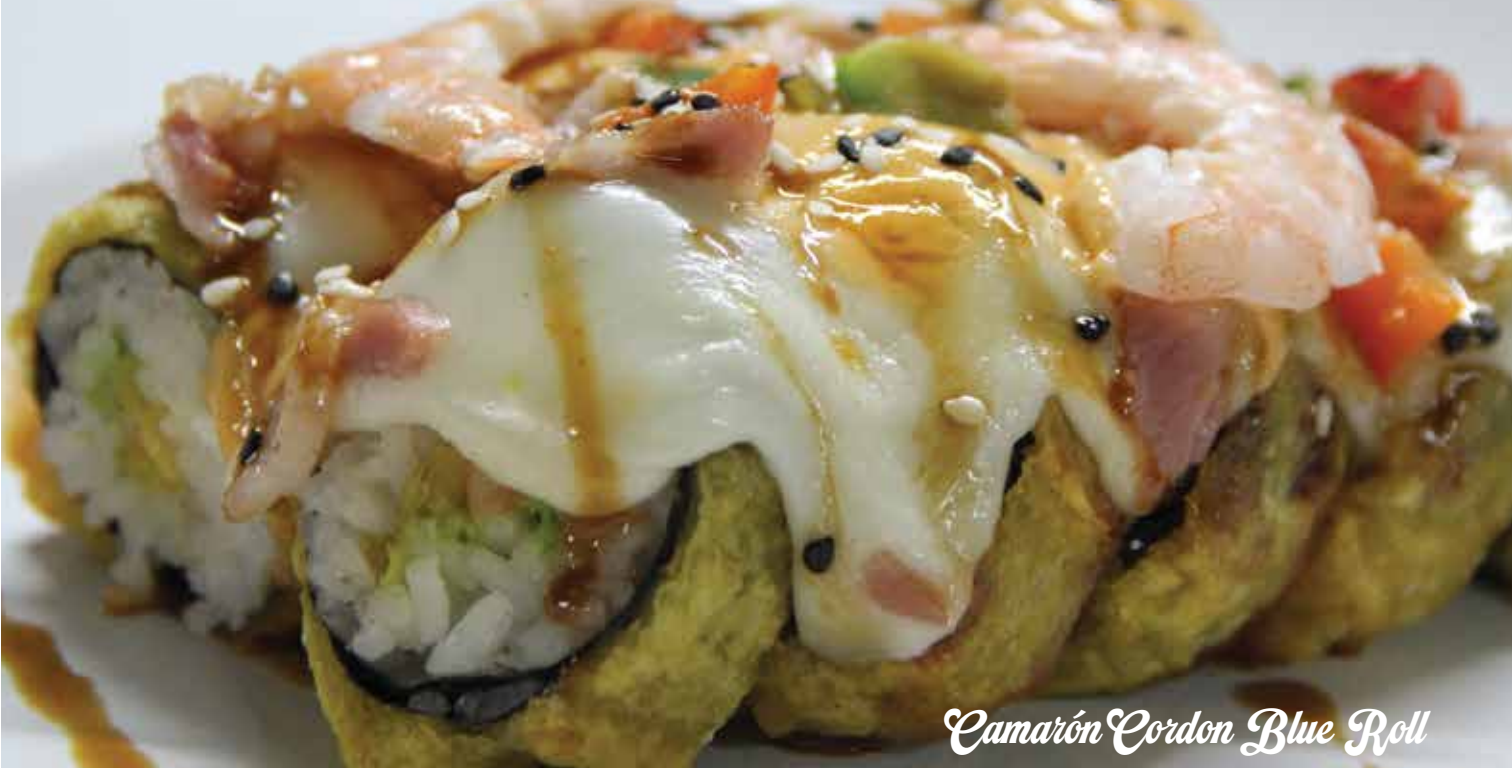
Camarón Cordon Blue Roll

CAMARÓN, QUESO, AGUACATE, QUESO GRATINADO, ARRIBA CON PULPO, MORRÓN Y TOCINO.