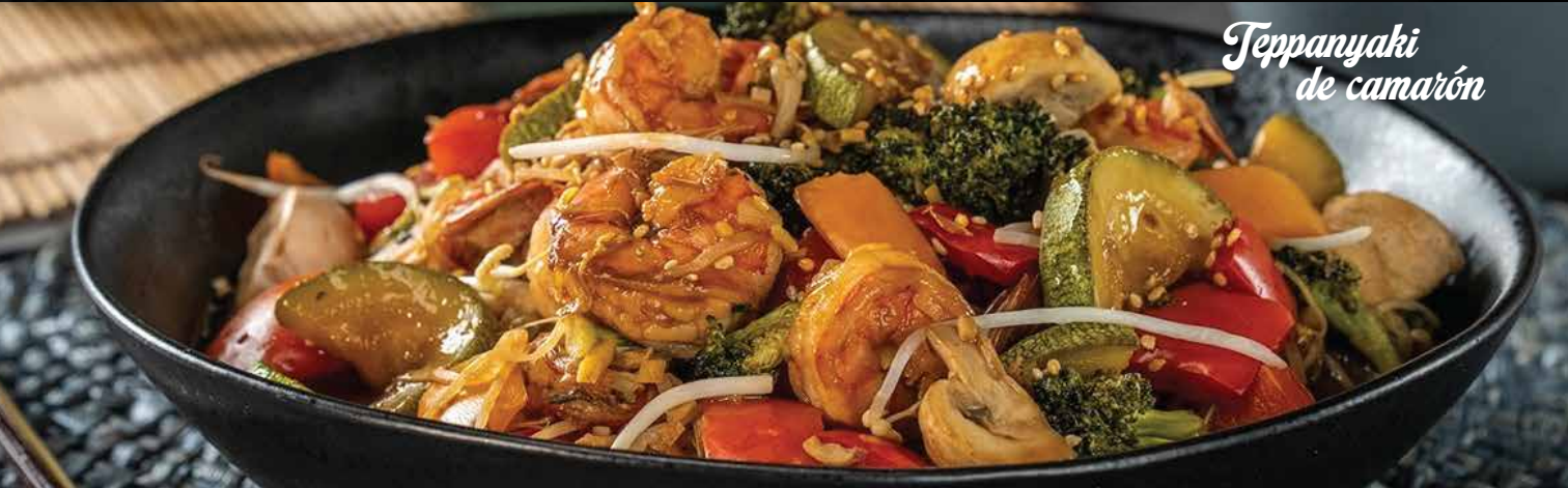
Teppanyaki de camarón