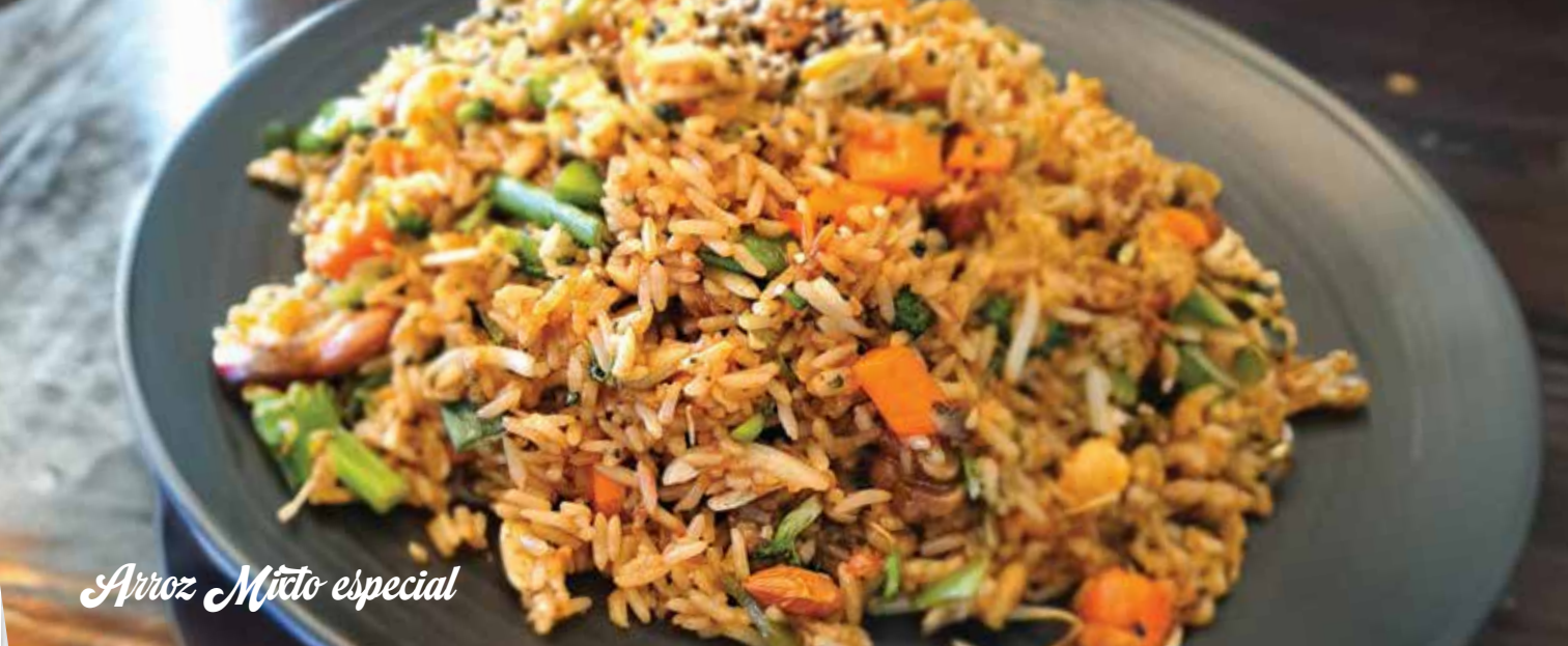
Arroz Mito especial