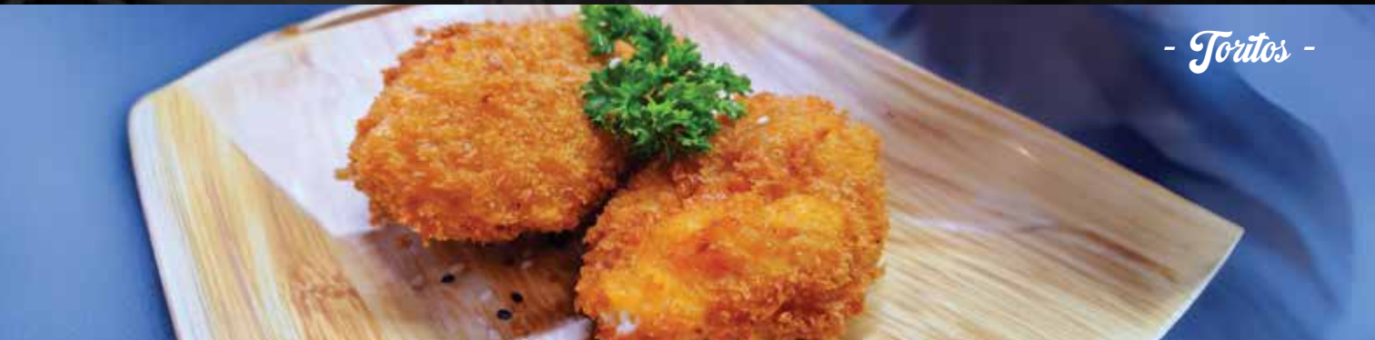
- Toritos -