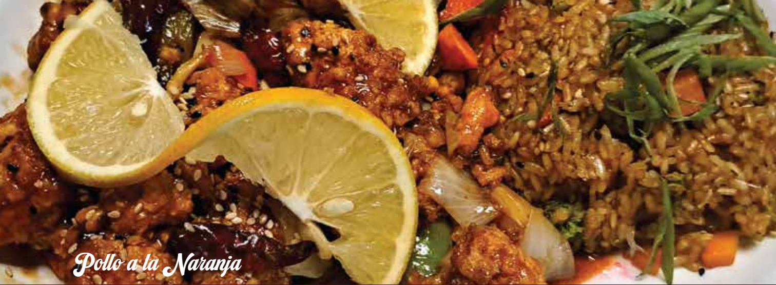
Pollo a la Naranja

A la Naranja 209 CEBOLLÍN, ZANAHORIA, CHILE DE ÁRBOL Y MORRÓN.