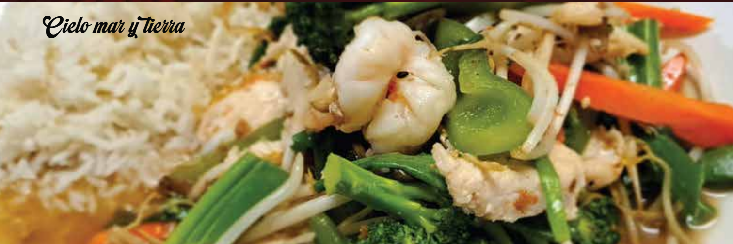
Cielo mar y tierra

Camarones al Ajillo 249 ACOMPAÑADOS CON PAPAS A LA FRANCESA Y ARROZ FRITO.