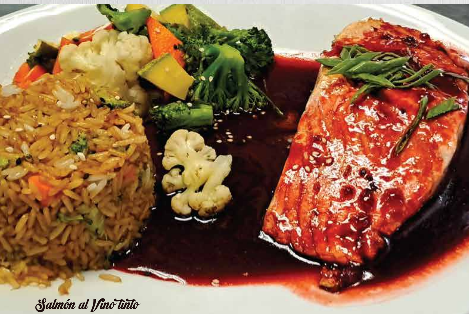
Salmón al Vino tinto